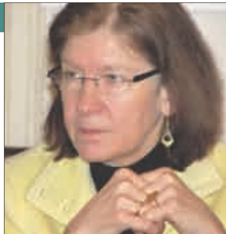
Г-жа Геше Карренброк, представитель УВКБ ООН в Российской Федерации

В последнее время партнерские отношения «Форума...» с УВКБ ООН ослабели. Встречаясь с представителем УВКБ ООН в России г-жой Геше Карренброк на разных миграционных мероприятиях, мы не раз договаривались встретиться для обстоятельного интервью. И вот, значит, наступило самое время — юбилейный год.