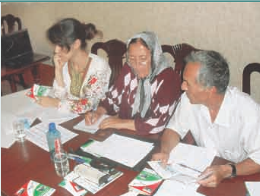
Ходжент. Тренинг по предотъездной подготовке для трудовых мигрантов

Есть вопрос, касающийся лично каждого трудового мигранта: это его безопасность. Этому вопросу тренеры уделяют особое внимание. На всем протяжении его пребывания в РФ и возвращения домой любого человека подстерегают опасности, будь то полет на самолете, передвижение на поезде или на автомобиле. От рисков никто не застрахован, и потому, как говорится, береженого Бог бережет. От пожаров, аварий, интоксикации, утопления в 2011-м году в РФ только на конец ноября погиб 371 гражданин Таджикистана. Цифры, прямо скажем, тревожные. Для предотвращения этих трагедий мы уже лет 10 выпускаем плакаты «Законная миграция — залог вашей безопасности», «Помни, тебя ждут дома». Развешиваем плакаты везде, где только возможно.