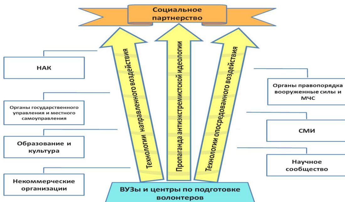
Схема 2. Субъекты партнерских отношений в регионе

Со стороны молодежи и общества в роли социальных партнеров в сфере реализации государственной молодежной политики в Орловской области выступают: